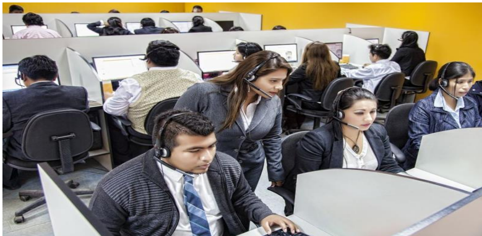
Figura N°04: Call Center Actividades Tecnología