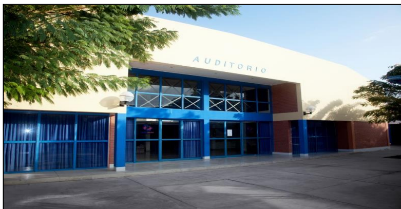
Auditorio – Complejo ZOFRATACNA