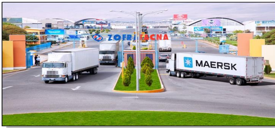
Ingreso al Complejo ZOFRATACNA

El Complejo de la ZOFRATACNA, cuenta con un CERCO PERIMETRICO de una altura promedio de 2.80 metros, el mismo que abarca las 180 hectáreas habilitadas.