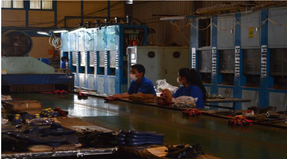
Figura N°03 :Industria de calzado