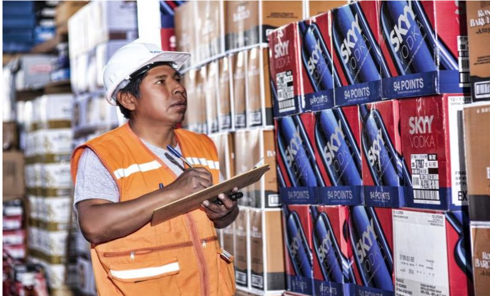
Figura N°01: Actividad de almacenamiento – Depósitos Francos-