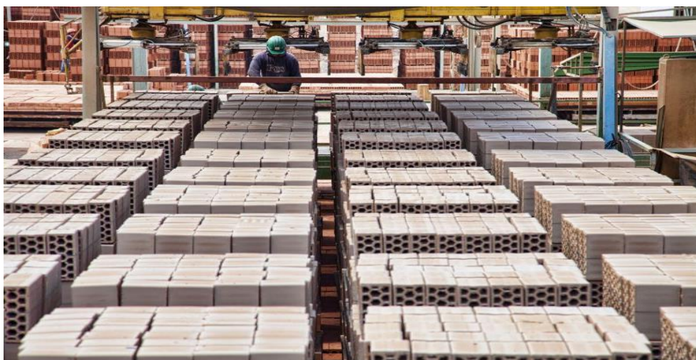
Figura N°05: Actividad Industrial