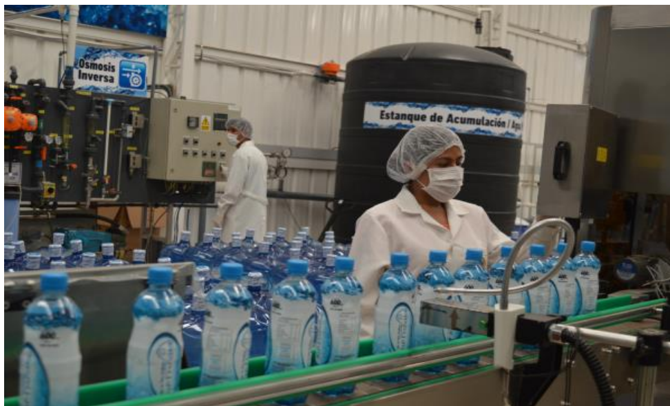
Figura N°02: Actividad industrial – Industrias Instaladas